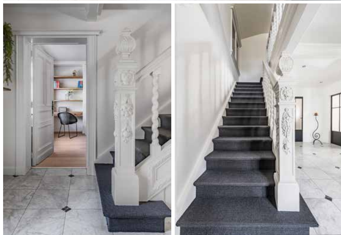
De trap is een blikvanger die de royale hal nog meer cachet geeft. Hij werd bekleed met een loper om de hond van het gezin 'grip' te geven.